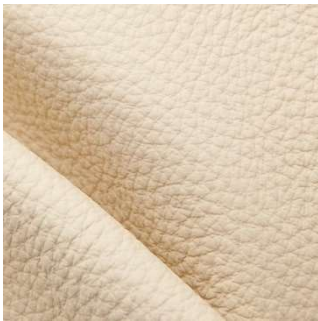
in den Narbungen hilft unsere Leather-Doc Leder Reinigungsbürste

Alle Leather-Doc Produkte beruhen auf jahrzehntelanger Erfahrung und Entwicklung. Leather-Doc Produkte sind auf höchstem Niveau und durch ständiger Laboruntersuchungen, für die Lederpflege und Lederreparaturen perfekt aufeinander abgestimmt. Zudem werden ALLE Leather-Doc Produkte in Deutschland hergestellt.