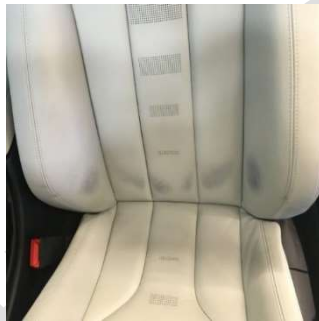
Bei extremen Abfärbungen von Bekleidung hilft unsere Leather-Doc BTA-Lösung