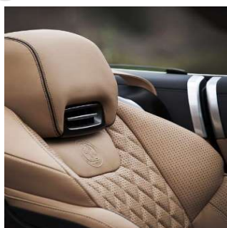
Unsere Leather-Doc Leder Versiegelung schützt vor Abrieb und Verfärbungen von Bekleidungsleder