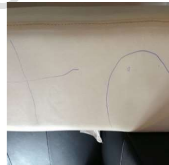
Bei Strichen durch Stifte hilft unser Leather-Doc Kugelschreiber Killer